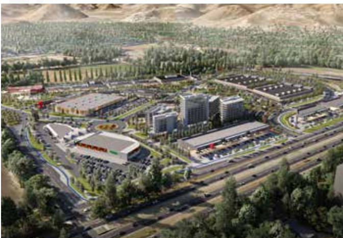
Proyección crecimiento a corto, mediano y largo plazo.

De esta manera se establece una zona de servicios, comercio y equipamiento a nivel comunal.